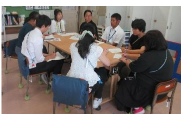
特別支援学級部会

山王中・山王小・御狩場小の教職員全員で国語、算数・数学・英語など17の各教科等の部会に分かれ、子供たちの指導方法等に関する情報交換等を行いました。