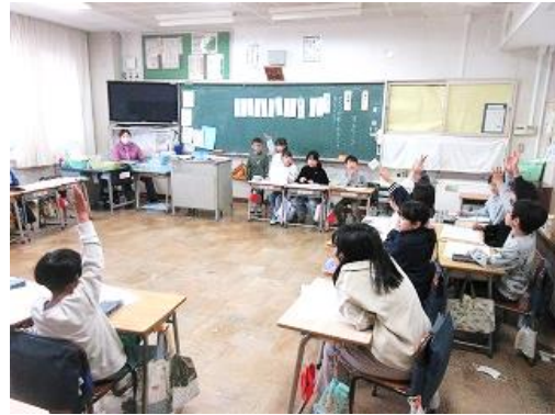
3/19 (木) 2年生 学級活動 年度末のクラスレクで何をするのかを学級会で話し合っていました。