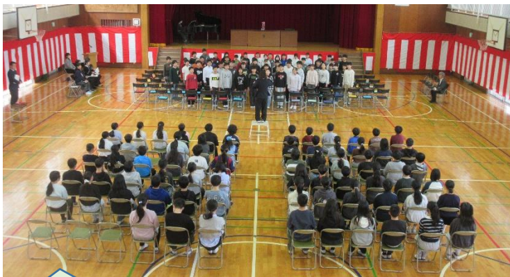
3/18 (水) 5, 6年生 卒業式予行練習。 さすが山王小の高学年。 100点満点のできればえでした。