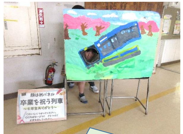
風の子学級の子供たちが卒業を祝って、「顔はめパネル」を作ってくれました。