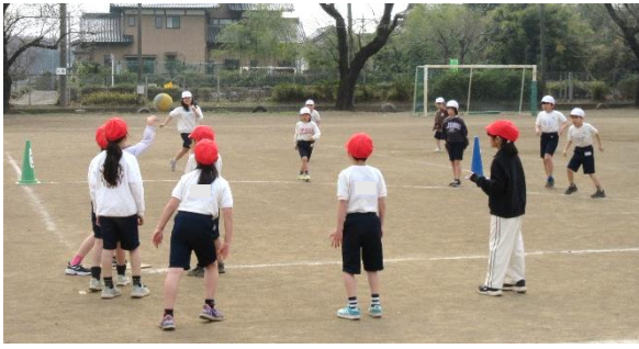
3/18 (水) 2年生 体育 簡単な作戦を立てながら、ボールを投げたり捕ったりする簡単なゲームをしていました。