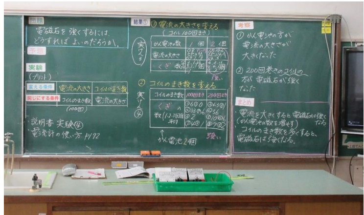
3/18 (水) 5年生 理科 「電磁石のはたらき」のまとめの授業でした。明日のテストに備えて、復習問題に取り組んでいました。